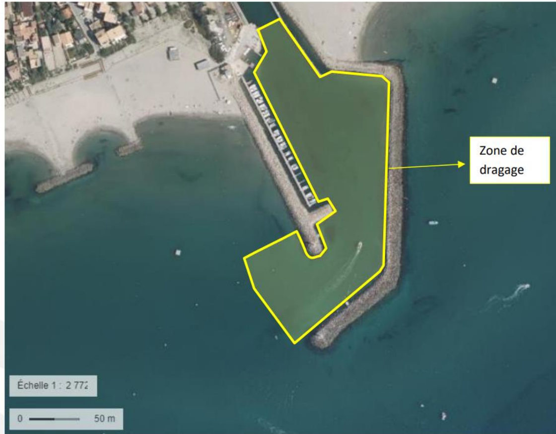
Figure 4 : Localisation de la zone de dragage