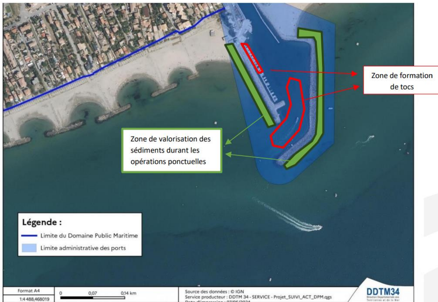
Figure 10 : Localisation de la zone de valorisation des sédiments pour les opérations ponctuelles