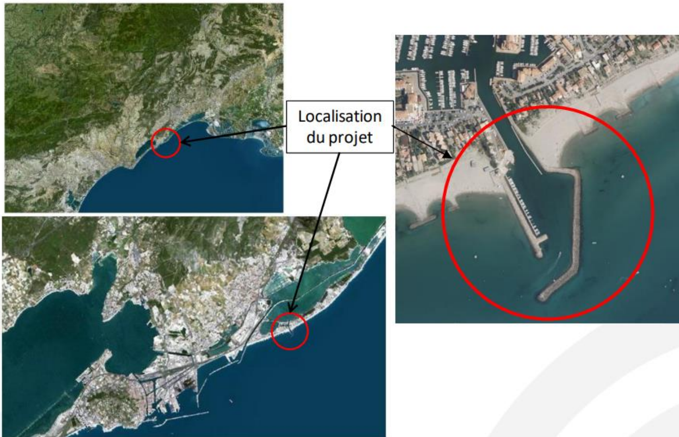
Figure 2 : Localisation géographique du port de Frontignan