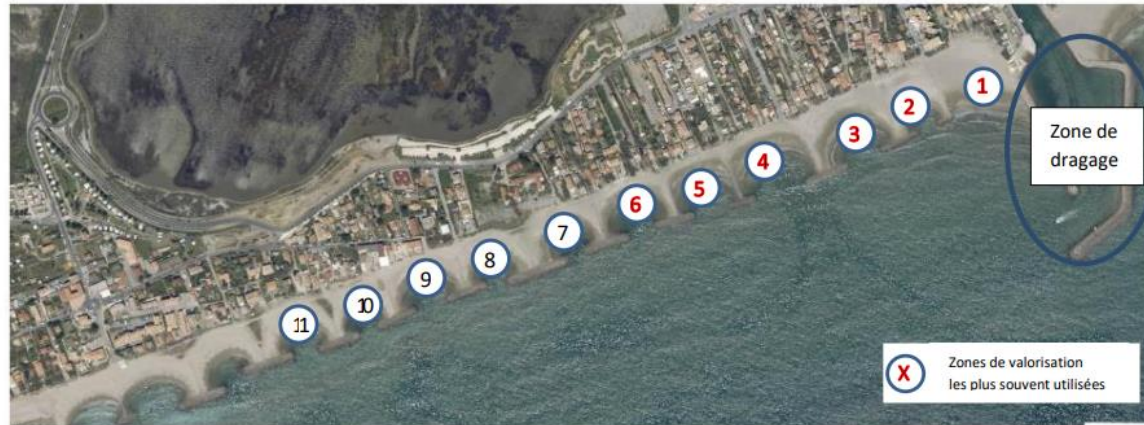
Figure 5 : Localisation des zones de valorisation des sédiments