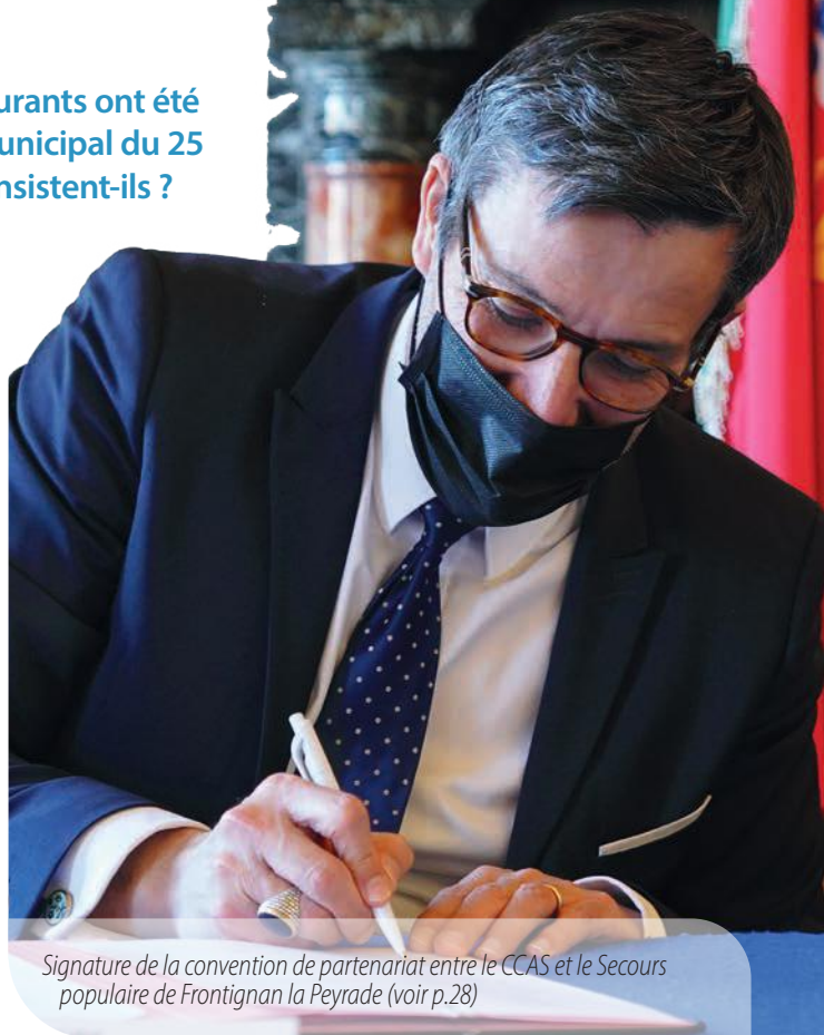
Signature de la convention de partenariat entre le CCAS et le Secours populaire de Frontignan la Peyrade (voir p.28)

Pour toujours mieux accueillir les habitants, améliorer le service rendu et favoriser les économies d'énergies, l'Hôtel de ville fera également l'objet d'une rénovation avec une étude et des travaux programmés. Dans le cadre du programme annuel des travaux d'accessibilité dans les bâtiments communaux et les équipements recevant du public, plus de 240 000 euros seront également engagés afin de permettre aux personnes handicapées de mieux accéder et utiliser les équipements ainsi que les services publics.